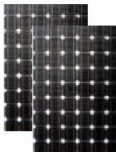
แผงโซลาร์เซลล์ 250W 2 แผง