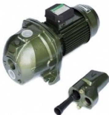
ปั้มน้ำรุ่น 3 เฟส ทำพิเศษ 1.5 Hp