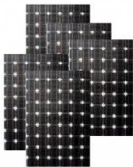
แผงโซล่าเซลล์ 250W 5 แผง