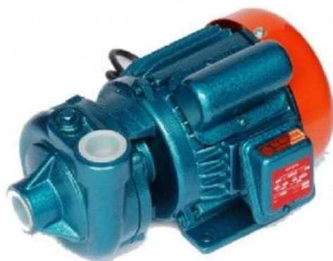
ปั๊มน้ำรุ่น 3 เฟส ทำพิเศษ 0.5 Hp